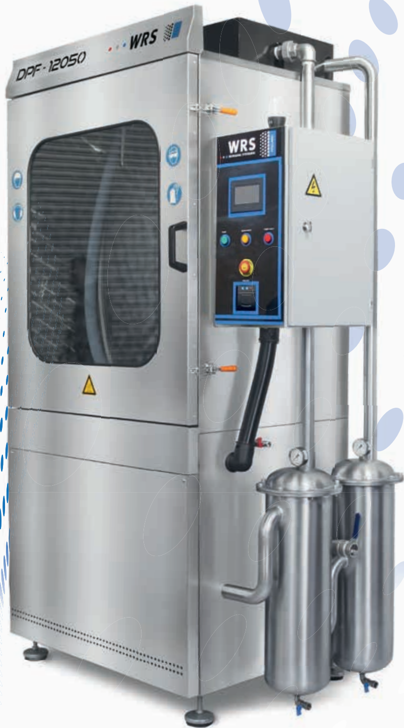
DPF 12050 REINIGER