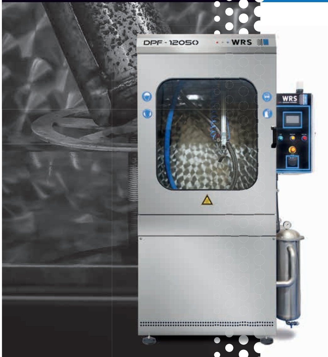
DPF 12050 DPF REINIGER